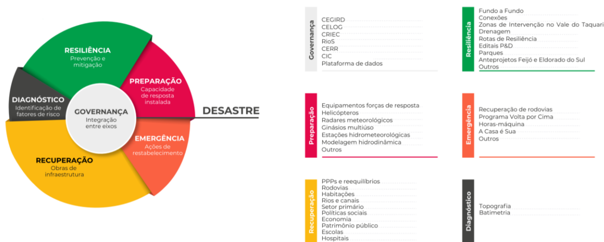
Figura 1: Eixos do Plano Rio Grande

outras estruturas destinadas à contenção de cheias, por meio do Fundo a Fundo da Reconstrução . Também faz parte desse eixo o apoio aos municípios para a execução de projetos de drenagem urbana, recuperação de pontes, pontilhões e galerias, construção de parques com a utilização de Soluções Baseadas na Natureza (SBNs), contenção de encostas e a pavimentação de estradas municipais para acesso aos municípios e localidades em caso de bloqueios das rodovias principais.